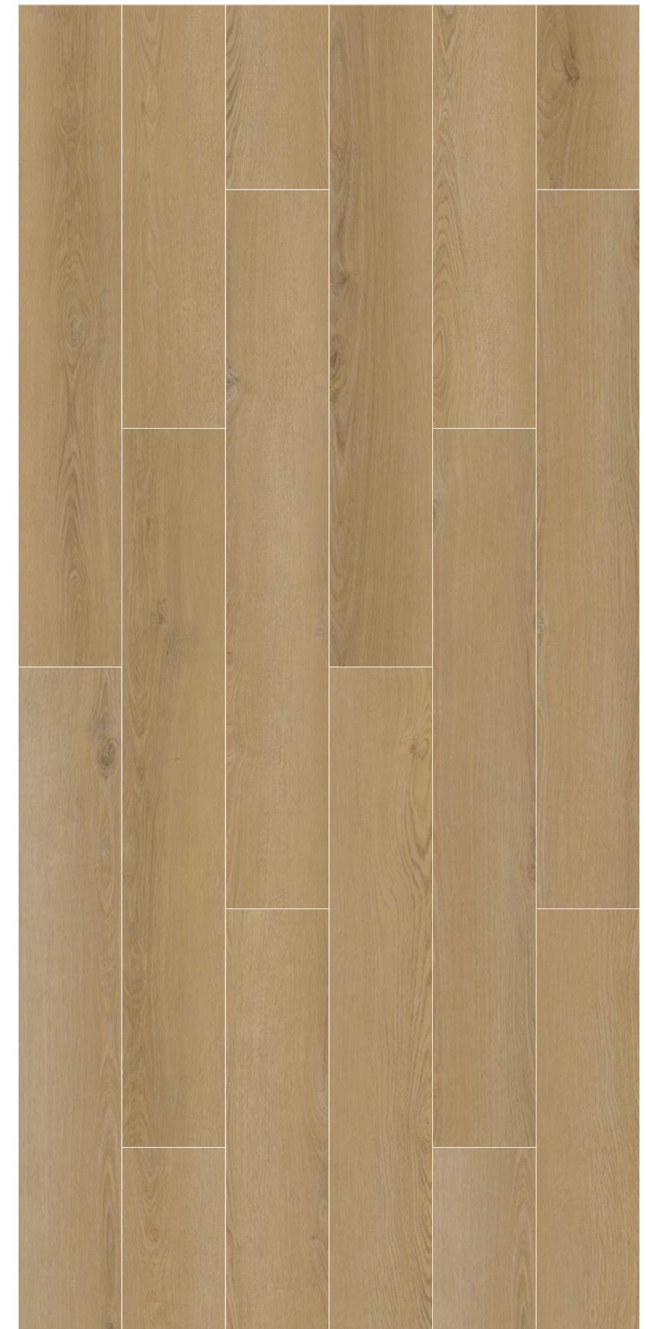
AMAZONIA _ EUROPEAN OAK _ 192 x 1235 mm