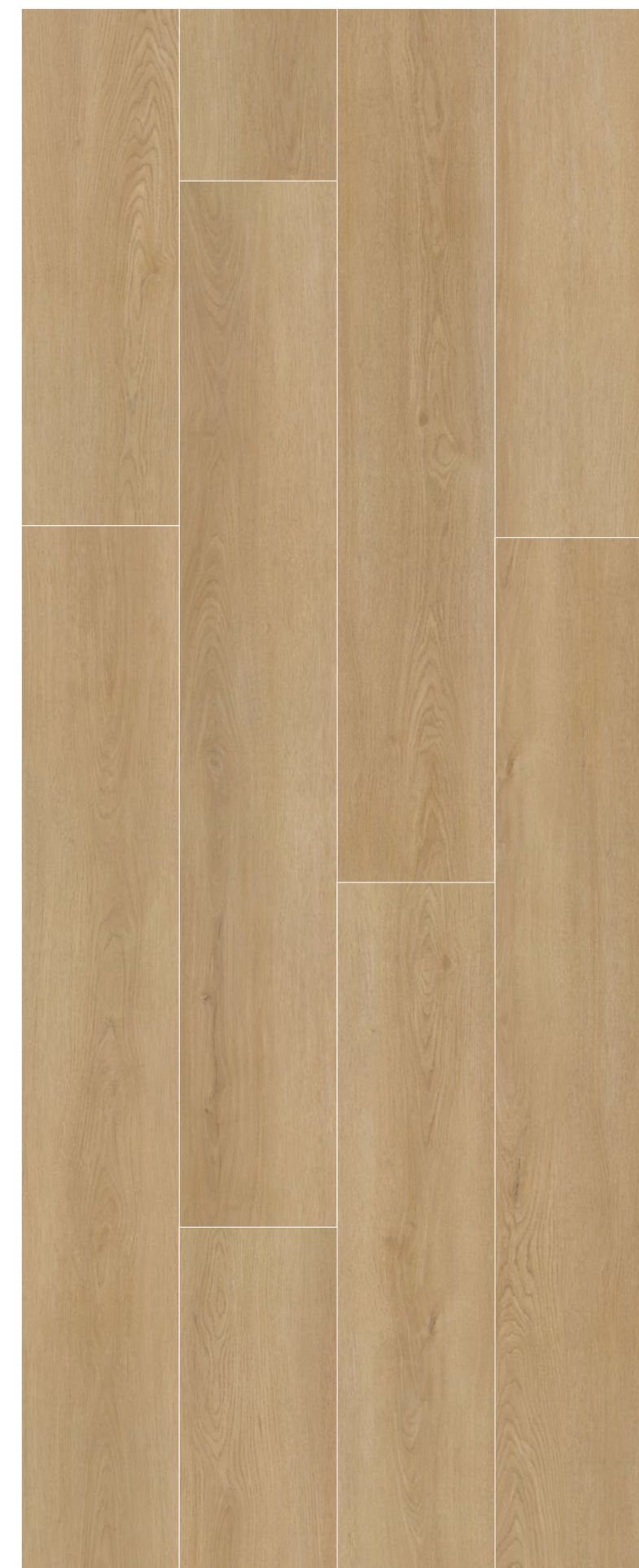
BOREAL _ FRENCH NATURAL OAK _ 232 x 1532 mm