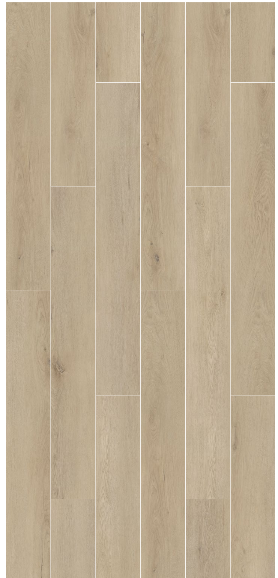
AMAZONIA _ NATURAL OAK _ 192 x 1235 mm