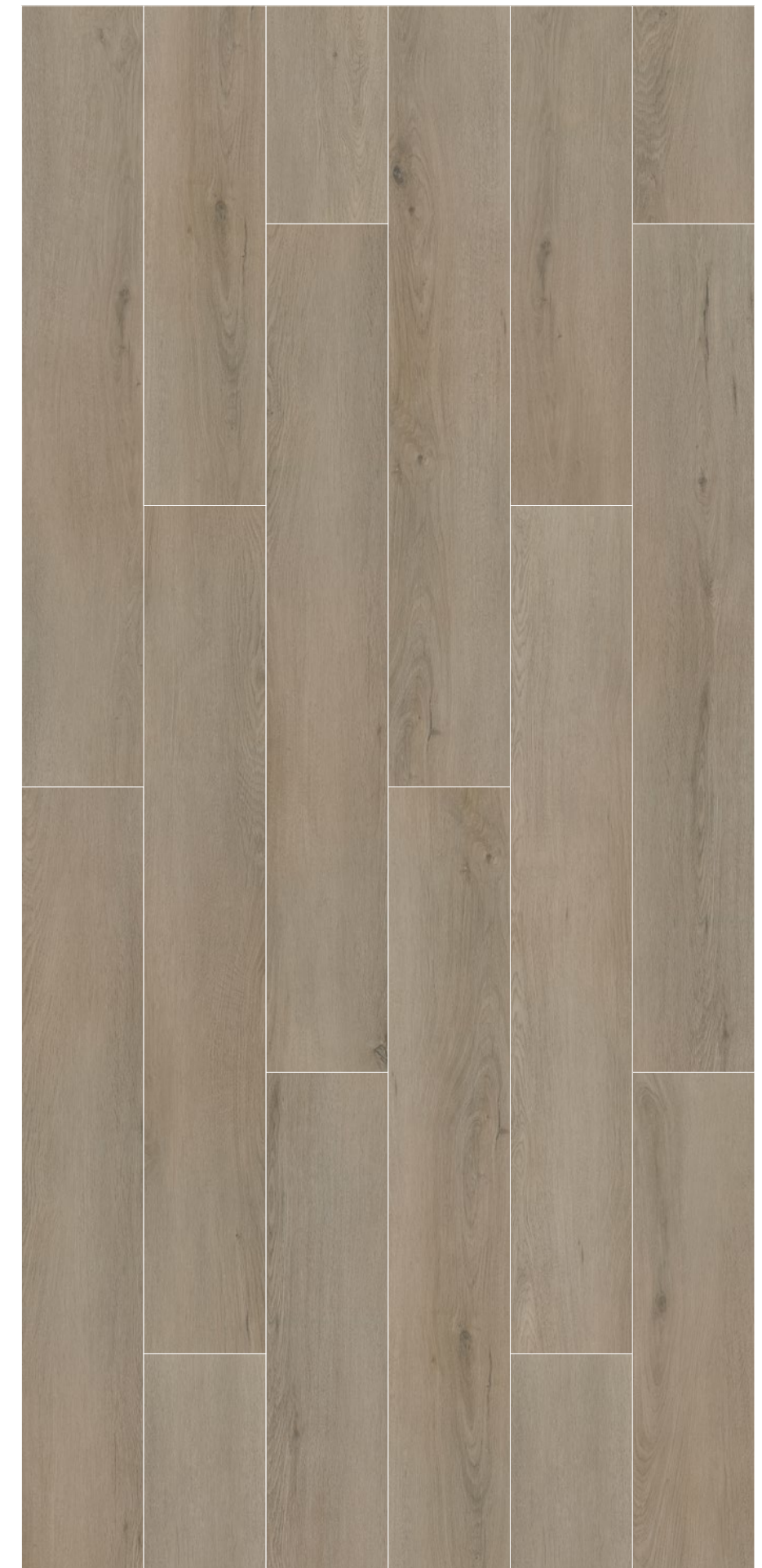
AMAZONIA _ GREY OAK _ 192 x 1235 mm