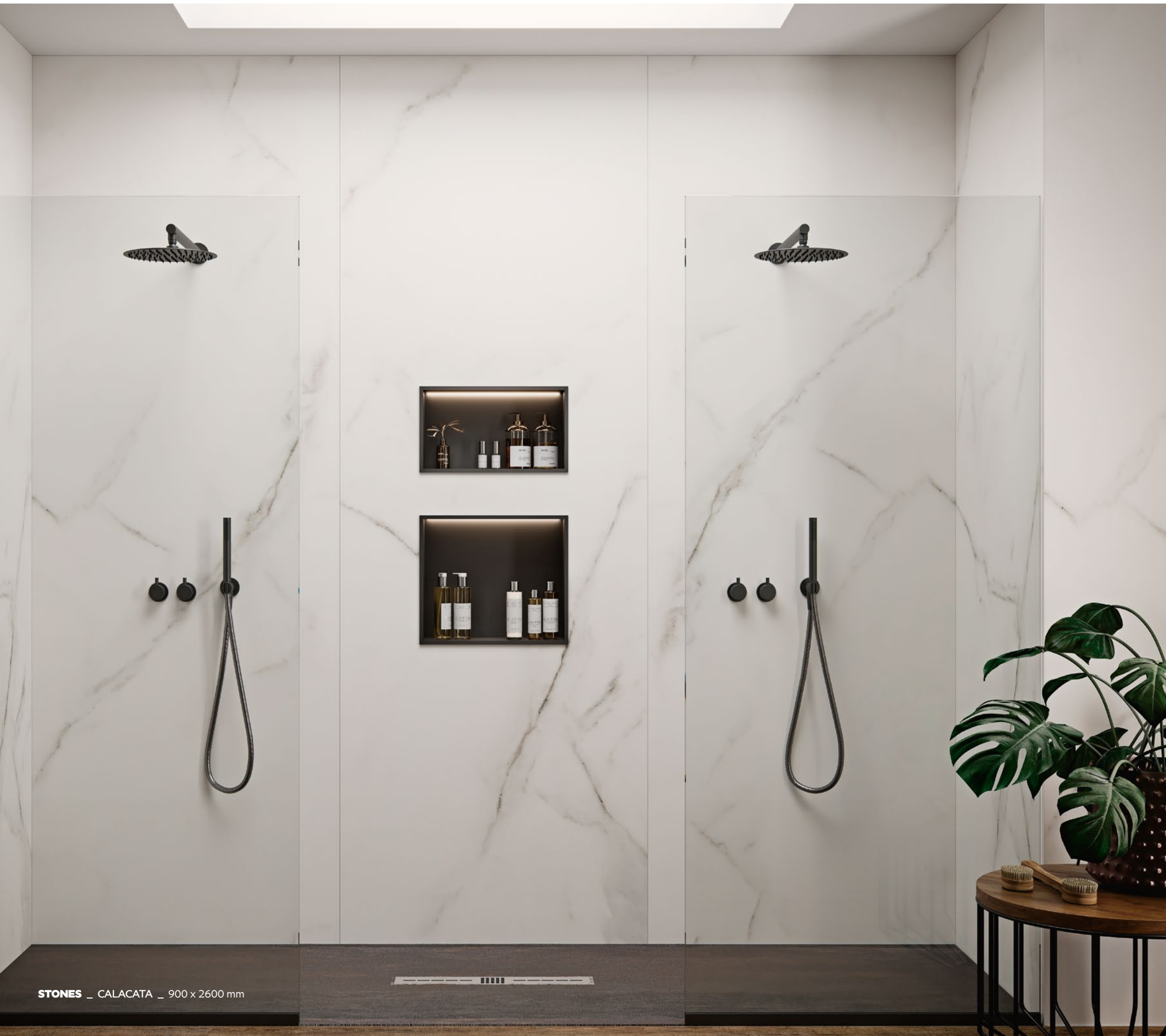
STONES _ CALACATA _ 900 x 2600 mm