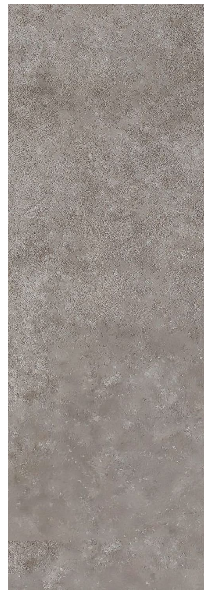
STONES _ CEMENT _ 900 x 2600 mm