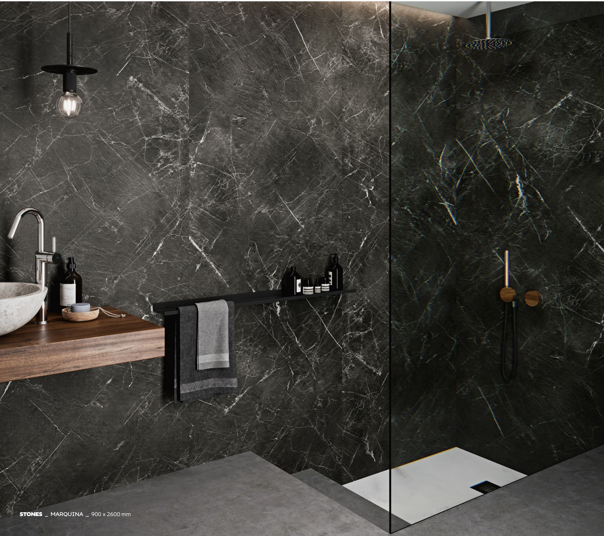
STONES _ MARQUINA _ 900 x 2600 mm