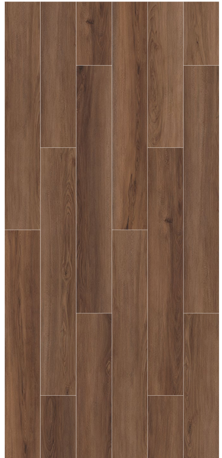
AMAZONIA _ WALNUT OAK _ 192 x 1235 mm